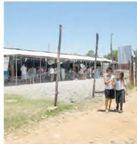
Los indígenas tienen en promedio 6 grados de escolaridad

El documento destaca que el abandono escolar sigue siendo uno de los principales retos del Sistema Educativo.