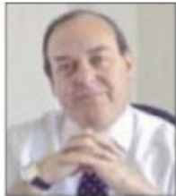
Por Ramón Zurita Sahagún

La competencia por la candidatura presidencial se encuentra en momento efervescente en la mayoría de los partidos, donde surge el encono entre los aspirantes y se forman grupos alrededor de los prospectos.