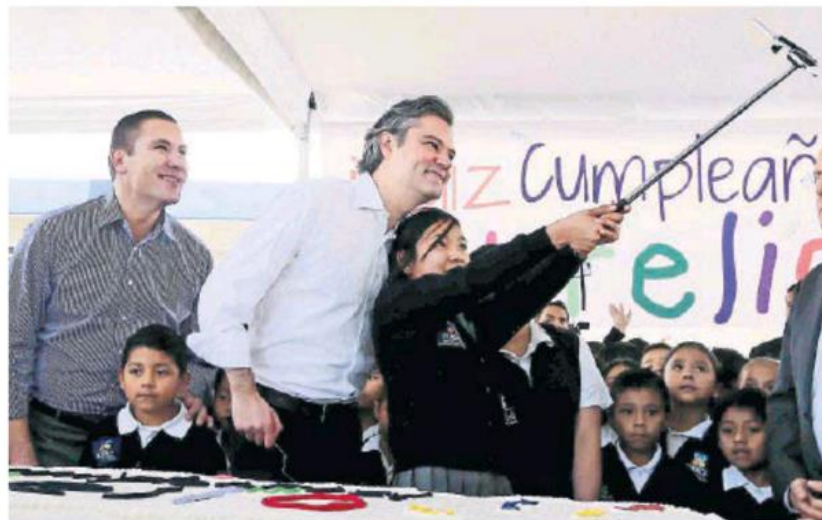
Ayer el secretario de Educación, Aurelio Nuño, y el gobernador Rafael Moreno Valle entregaron la rehabilitación del BINE Juan Crisóstomo Bonilla .

El secretario y el gobernador entregaron la rehabilitación y ampliación de la infraestructura del Benemérito Instituto Normal del Estado (BINE) Juan Crisóstomo Bonilla , en la que se invirtieron 93 millones 797 pesos.