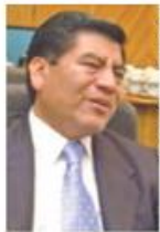
Mario Marín Torres