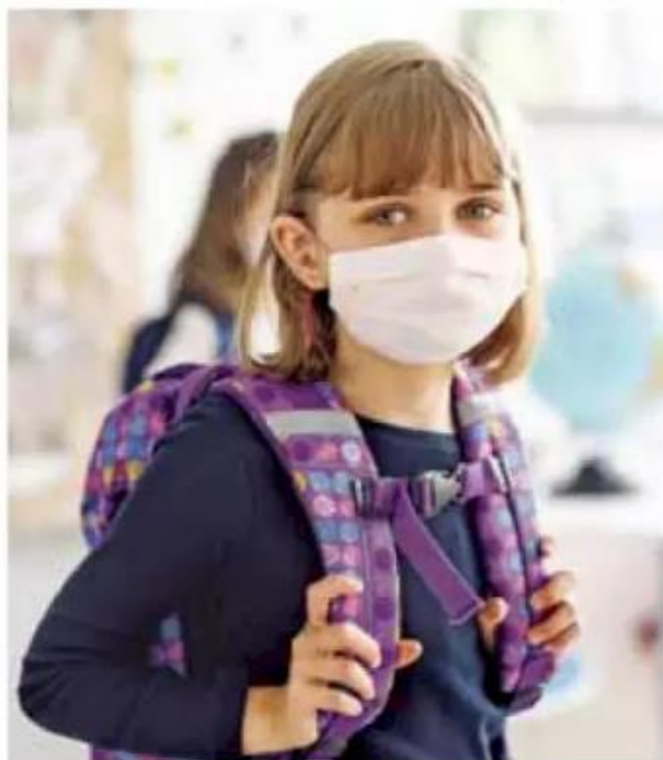
Cuarentena. Aún falta mucho para retomar las clases regulares en las aulas.

Situación. A pesar de que se sigue estudiando desde casa, es importante estar al pendiente de las fechas para preinscripciones a educación preescolar, primaria y secundaria.