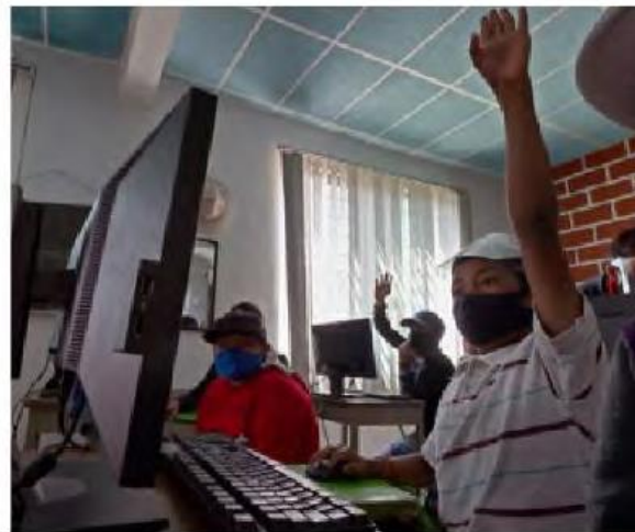
Niños asisten a una clase de informática en el barrio de Escalerillas, en Chimalhuacán, estado de México, gracias al apoyo de organizaciones sociales.

• NIÑOS POBRES de Chimalhuacán han podido seguir sus estudios gracias al apoyo de una ONG que donó computadoras con internet