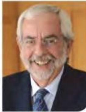
ENRIQUE GRAUE WICCHIERS