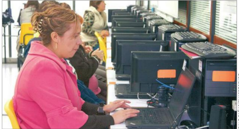
El proceso se ha realizado con normalidad, participación y eficacia, informó la Secretaría de Educación Pública.

Guerrero, Chihuahua, Coahuila, Hidalgo, Quintana Roo, Sonora y Yucatán alcanzaron niveles de concurrencia superiores al 95 por ciento. Y en Morelos, Nayarit, Puebla, Tamaulipas y Veracruz la participación superó al 90 por ciento.