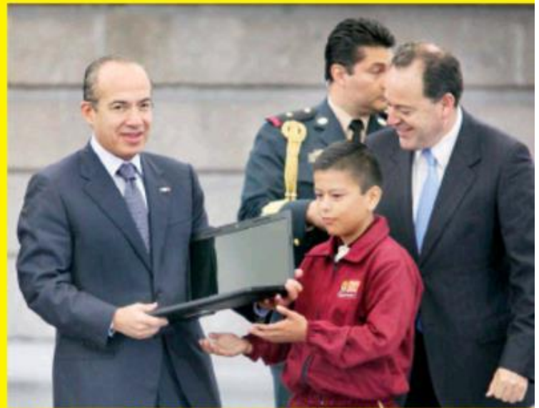
El ex presidente Felipe Calderón entregó tabletas y lap-tops a niños de primaria y secundaria en su administración.