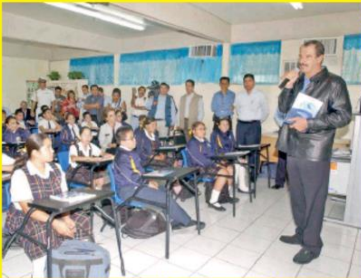
Durante su sexenio, el presidente Vicente Fox presentó el proyecto Enciclomedia, el cual fue criticado por los errores en su planeación.