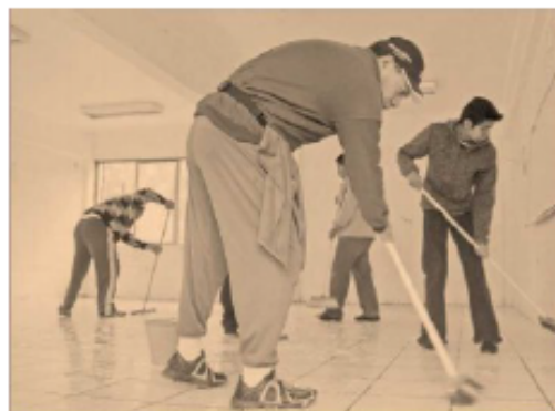
El programa consiste en la rehabilitación de centros educativos.

Por lo que respecta al primer año, la prime-