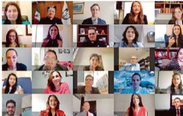
- Fortaleza. Los estudiantes lograron superar los retos de la pandemia.

“Esto se convierte en un campanazo a nuestra conciencia precisamente hoy, en este evento, en el que queremos reconocer la excelencia académica de todos ustedes, alumnas y alumnos de la Universidad Anáhuac México; ustedes que han podido mantener su nivel de enseñanza, que han tenido los medios para seguir estando