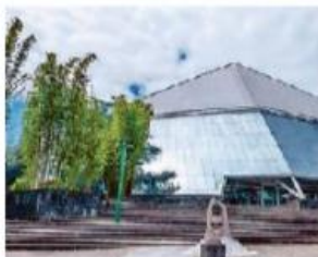
- Unión. Para la UV es hora de sumar.

Paulatinamente se comienzan a estructurar tres grandes fuerzas