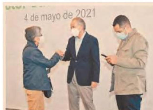
Con la vacunación, San Luis Potosí avanza en la generación de las condiciones necesarias para un regreso seguro a las aulas.

Las sedes de la vacunación se instalaron en los municipios de: Soledad de Graciano Sánchez, Ciudad Valles, Rioverde, Tancanhuitz, Matehuala, Tamazunchale, Axtla de Terrazas, Cárdenas, Tamuín, Salinas, Charcas, Cerritos, Santa María del Río y San Luis Potosí.