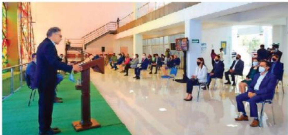
- Recinto. El rector presentó el nuevo espacio que lleva el nombre del primer director de la facultad.

La biblioteca, que lleva el nombre del primer director de la Facultad —fundada hace 65 años— y la segunda más grande de la institución, expresó el rector, es una obra única y absolutamente irrepetible, pues el vitral monumental es obra póstuma del Doctor