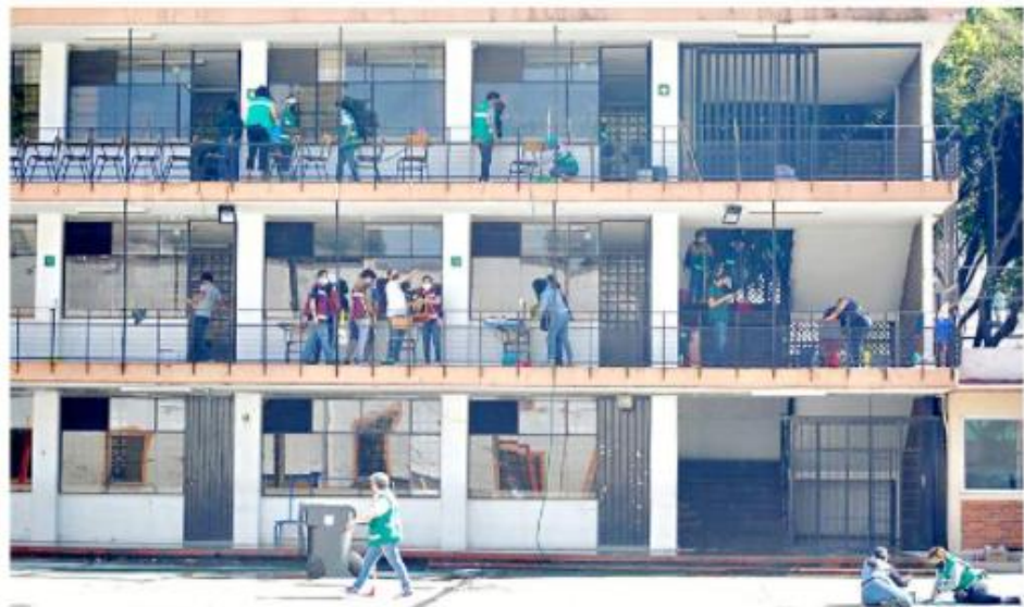
En las escuelas de la Ciudad de México, padres de familia y personal educativo realizan a marchas forzadas los tequios para dar mantenimiento y limpiar los planteles.

“Ya llevamos más de un año tres meses donde niños, niñas, jóvenes no han tenido oportunidad de regresar a clases, y que este periodo de cierre escolar, de cierre del periodo escolar, abre una oportunidad de regularización”, indicó.