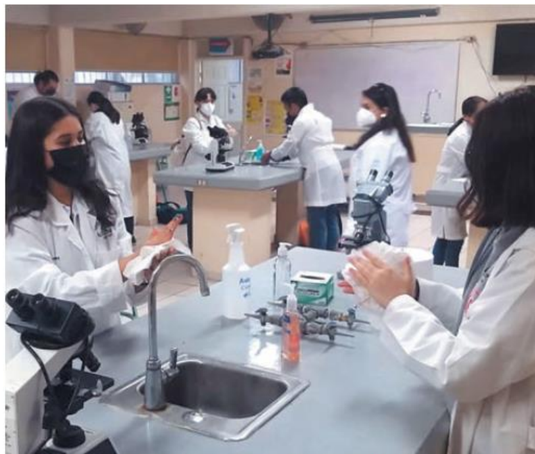
• PROGRESIVO. En Baja California ya regresaron algunas primarias y secundarias.

En todas ellas se mantuvo un aforo menor a 30 por ciento de las instalaciones, se colocaron filtros en las entradas de los colegios y se capacitó al personal para promover y atender las emergencias sanitarias, tales como el uso obligatorio de cu-