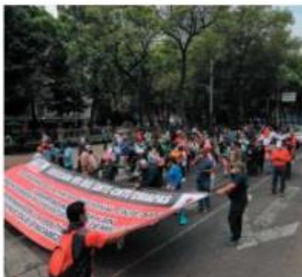
Marcharon de Paseo de la Reforma al Zócalo capitalino

Los manifestantes caminan por los carriles centrales de ambos sentidos de la avenida, desde el Ángel de la Independen-