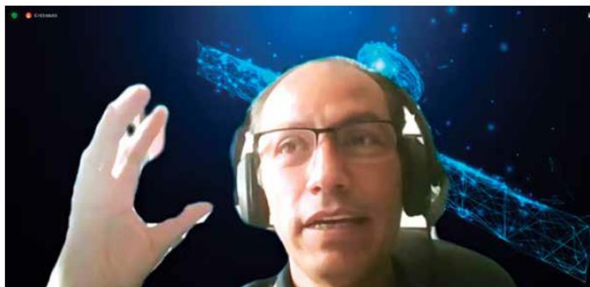
El Sistema Europeo de Navegación Satelital Global sirve para mejorar la visibilidad de la navegación por satélite de barcos, aviones, trenes, automóviles, teléfonos inteligentes y equipos robóticos.

El Centro de Información Galileo (GIC) para México, Centroamérica y el Caribe, promovido y cofinanciado por la Comisión Europea (Dirección General de Industria de Defensa y Espacio), ayudará a mejorar la visibilidad de la navegación por satélite de barcos, aviones, trenes, automóviles, teléfonos inteligentes y equipos robóticos.