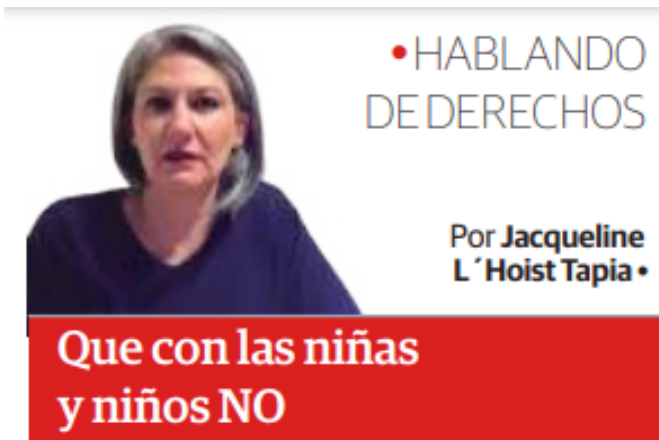
Facebook: Jacqueline L'Hoist / Instagram: Jacqueline.lhoist

Cuando pensamos en una niña o un niño de tres a cinco años, ¿cuál es la primera imagen que se nos viene a la mente? Quizá ojeando algún libro o sujetando un lápiz de color. En esta edad, ellas y ellos hacen dibujos con más sentido y tienen relación entre sí y con su entorno. Un niño o una niña de cinco años ya aprende lo maravilloso de saber escribir y leer, y el juego es su mundo, la imaginación vuela y cualquier avance es un paso gigantesco. Padres y madres vivimos este momento embobados, sus risas y abrazos llenan el espacio y vemos con ilusión su crecimiento y, por supuesto, es el momento de la escuela, de preescolar.