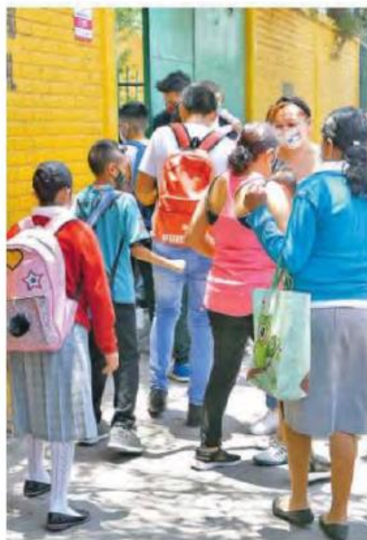
Regreso Voluntario a Clases Presenciales 2021; salvaguardaron a educandos más de 6 mil uniformados de SSC

La SSC recomienda que en las clases presenciales se acaten todas las medidas sanitarias, como el uso obligatorio de cubrebocas, gel antibacterial y guardar, en la medida de lo posible, la sana distancia.