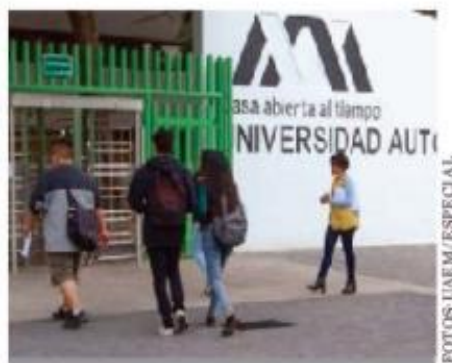
- Sucesión. La UAM tendrán nuevo rector.

Nueva ventana. Una vez concluido el proceso electoral del pasado 6 de junio, la conformación de una nueva legislatura abre de nueva la puerta, y la posibilidad, a que los legisladores trabajen en la conformación de un presupuesto benéfico para las instituciones de educación superior. Muchas caras repetirán tres años en el congreso y eso permite que la labor no comience desde cero. Qué lejos parecen aquellos años en los que los rectores llamaban a la creación de los presupuestos plurianuales para dar certidumbre a las universidades públicas. Ahora, la urgencia parece ser la creación de un fondo que permita avanzar en la gratuidad de la educación superior del país. En septiembre inicia trabajos el congreso y entonces una nueva oportunidad de ganar terreno en el escenario presupuestal se avecina. ☺