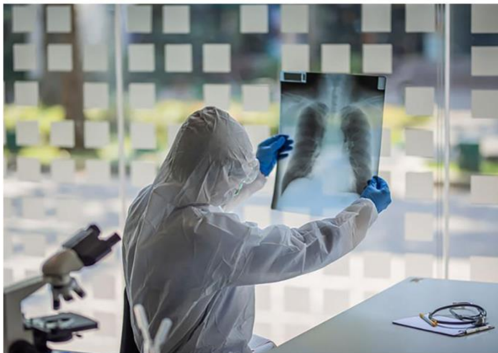
Los nuevos criterios limitan el ingreso, la permanencia o la promoción en el sistema porque privilegian a investigadores/as que participen en los Pronaces.

Entre otros problemas, los integrantes de la Red ProCienciaMx, señalan que los nuevos criterios de evaluación buscaban mejorar los anteriores, que eran perfectibles, pero terminan impactando negativamente a los científicos mediante tres