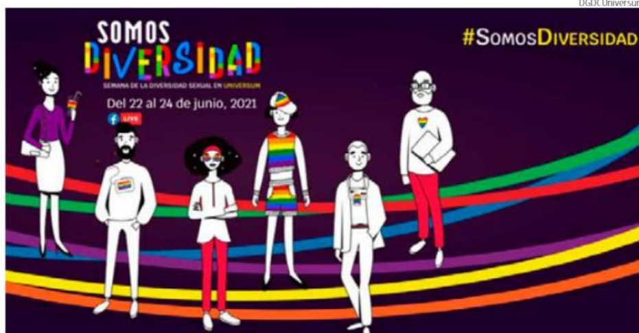
La Semana de Diversidad Sexual busca, entre otros objetivos, impulsar una actitud y líneas de acción hacia la inclusión plena de derechos, mediante el aporte de la divulgación y la investigación científica.

La inauguración se llevará a cabo este martes a las 13:00