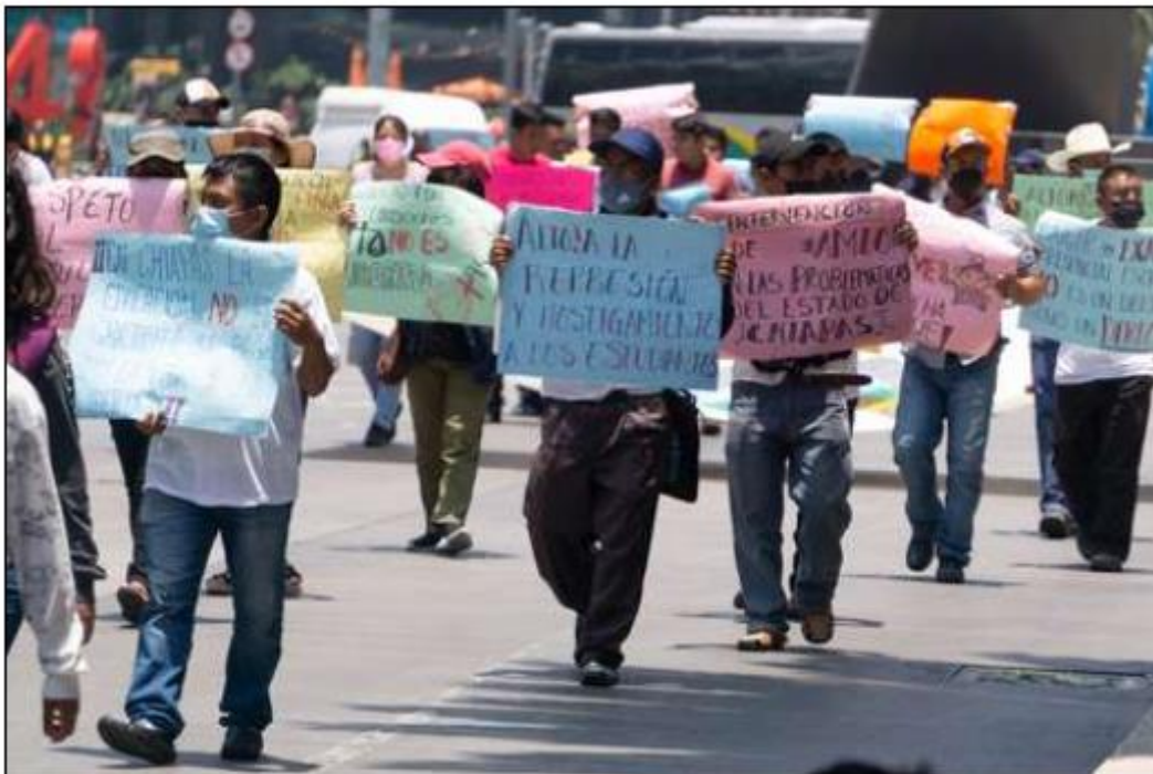
▲ Alumnos de la Normal Rural de Mactumactzá se movilizaron ayer en la CDMX para exigir la libertad incondicional de 91 compañeros que enfrentan cargos en Chiapas.