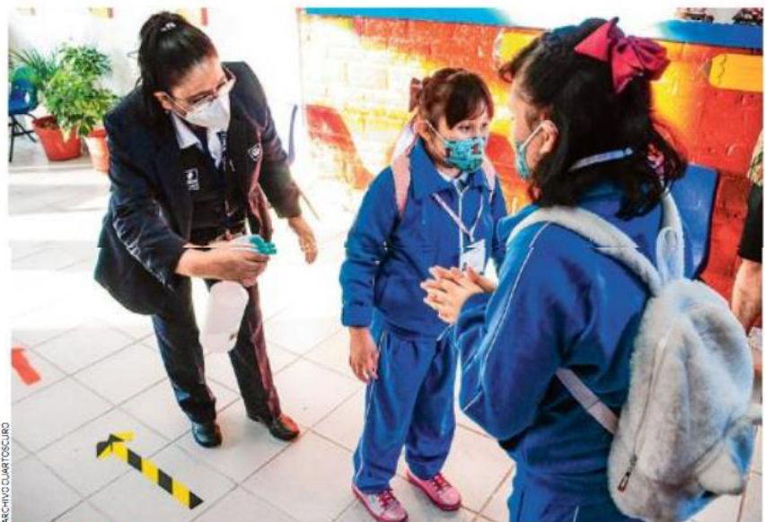
AMBIGÜEDAD. Pese a que la Ssa reconoció que el país atraviesa por una tercera ola de contagios, el Presidente advirtió que el ciclo escolar 2021-2022 será presencial.

aviso donde se indica que los ciudadanos con esquema de inmunización completo ya no se catalogarían como vulnerables o en riesgo de fallecer por Covid-19, los que podrán “retomar diversas actividades en beneficio del país”.