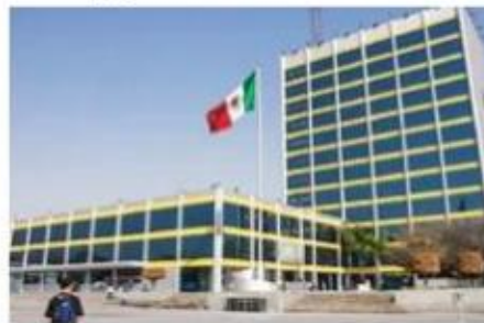
DECISIÓN. La Universidad Autónoma de Nuevo León abrirá el 4 de octubre.

Sin embargo, la UANL dio a conocer que los estudiantes de nivel medio superior, profesional y posgrado continuarán en línea, mientras que el servicio social podrá realizarse de manera presencial, solo si el lugar en el