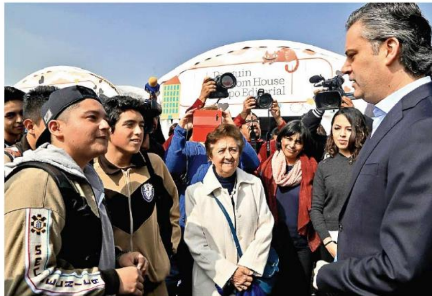
El Secretario de Educación, Aurelio Nuño, visitó la sede la Feria Internacional del Libro Infantil y Juvenil, donde garantizó que se mantendrán los planes estratégicos de la dependencia.

La madrugada del 11 de noviembre, la Cámara baja aprobó el presupuesto para el próximo año por un monto de 4.8 billones de pesos, dentro del cual los legisladores realizaron reasignaciones por