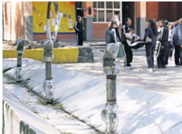
La iniciativa de Ley de Ingresos 2017 plantea destinar una parte de la recaudación del IEPS para bebederos en escuelas, pero no los etiquetaron

“El Presupuesto de Egresos de la Federación para el Ejercicio Fiscal 2017 aprobado deberá prever una asignación equivalente a la recaudación estimada para la Federación