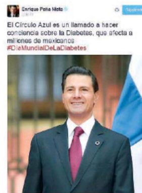
El presidente Enrique Peña Nieto envió dos tuits con motivo del Día Mundial de la Diabetes.

por concepto del Impuesto Especial sobre Producción y Servicios aplicable a las bebidas saborizadas, de acuerdo con lo previsto en el artículo 1 de la Ley de Ingresos de la Federación para el Ejercicio Fiscal de 2017, una vez descontadas las participaciones que correspondan a las entidades federativas, para destinarse a programas de promo-