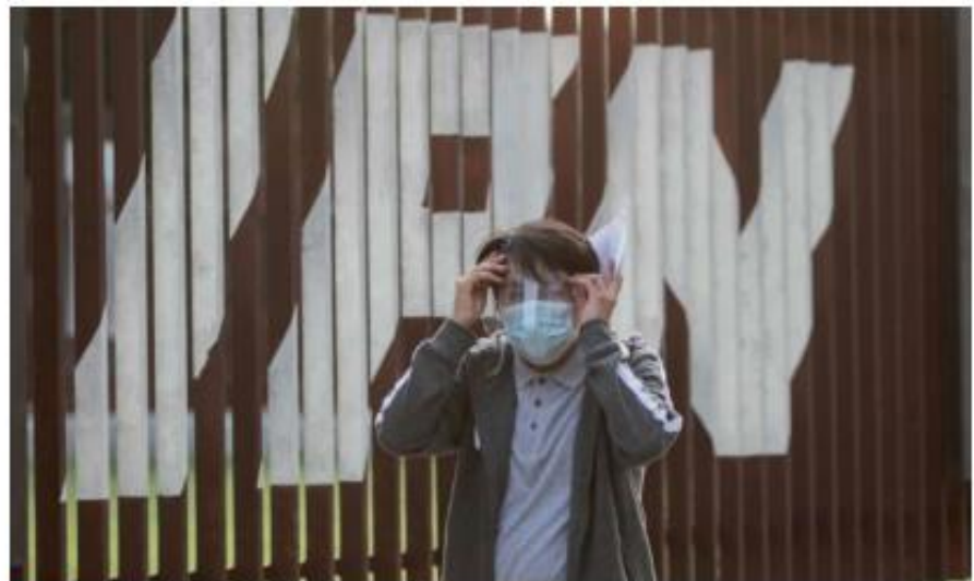
Se planteó un horizonte que va del esquema en línea, uno híbrido que permita de forma escalonada la transición.

SE PODRÁN HACER uso de las instalaciones, voluntariamente y bajo el consentimiento escrito