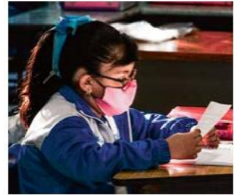
ESCUELA. Volverán a las aulas 31 mil 972 alumnos, en una primera etapa.

El funcionario agregó que no existen condiciones para movilizar a los 650 mil 232 estudiantes de los niveles básico, media supe-