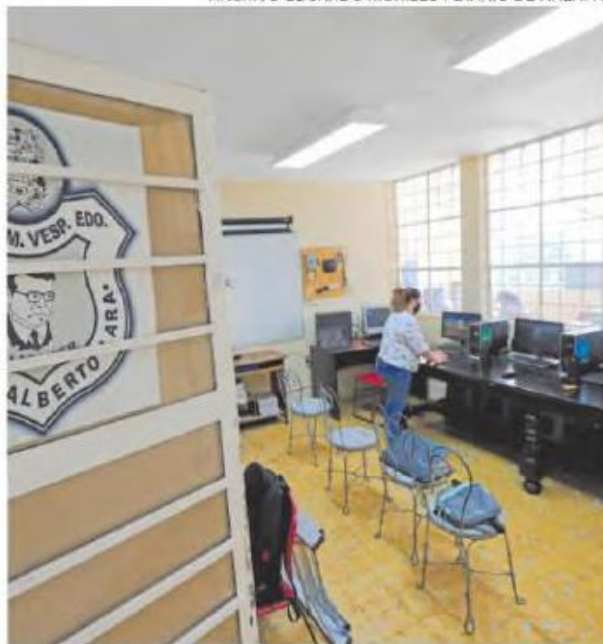
Se prevé que las clases inicien el 23 de agosto

El escrito ya generó controversia porque dentro de las actividades que sugiere para recibir a los alumnos se pide a los maestros que inflen globos y coloquen dentro un mensaje. Mientras todos bailan de manera festiva, se lanzarán los globos al aire para que cada alumno tome uno de otra persona y luego se revienten. Algunos médicos indicaron que ésta es la mejor forma de propagar el virus.