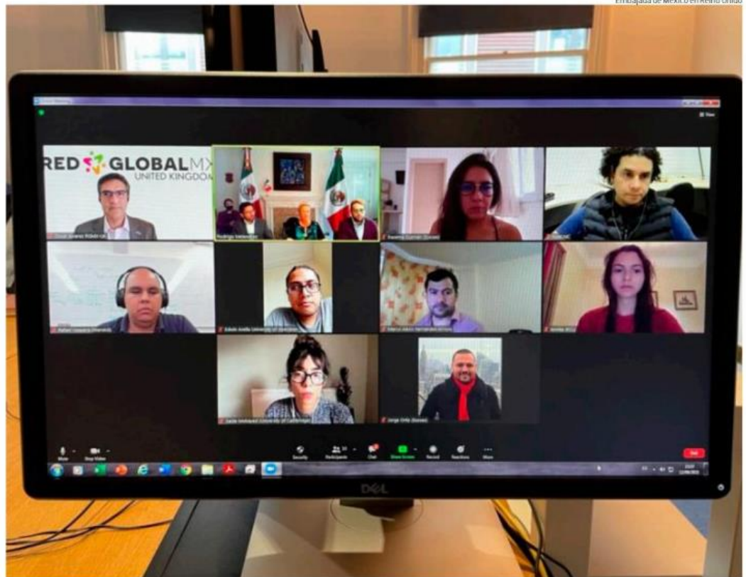
La Sociedad de Estudiantes Mexicanos en Reino Unido pide un diálogo público para resolver el problema actual.

"Las personas que suscribimos, estudiantes mexicanos becados en el extranjero, estamos en la incertidumbre. A 42 de nuestros compañeros, quienes nunca pensaron en la desaparición de los fideicomisos cuando firmaron sus contratos con la Secretaría de Energía, han sido abandonados. No tendrán dinero para finalizar su tesis porque desaparecieron los fondos y ellos nunca previeron que una pandemia cerraría sus laboratorios y talleres. Ellos y ellas fueron enviados por su gobierno a estudiar soluciones para la crisis climática. Y hoy su mismo gobierno no les ha dado ninguna solución", inicia la carta de cinco párrafos.