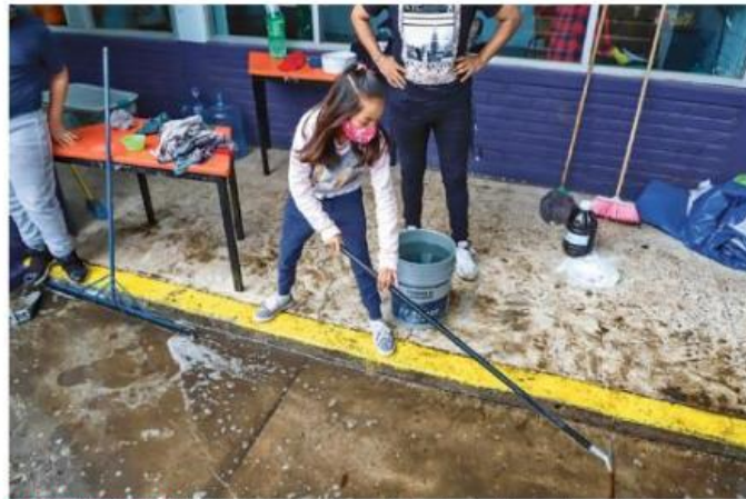
MARCHAS FORZADAS. Padres de familia están acudiendo a los planteles escolares a darles mantenimiento y limpieza, previo al regreso a clases de sus hijos.

"Prácticamente no tenemos información; apenas vamos a contactar a los papás que nos van a ayudar en la limpieza (del plantel) inde-