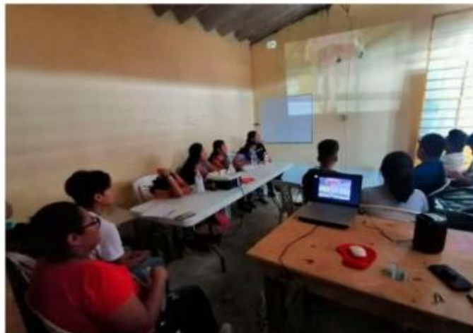
Sin explicaciones fueron separados de su cargo.

El ahora excoordinador académico de la sede la UBBJ en Jo-