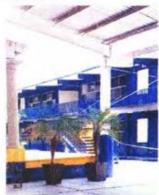
Las clases se suspendieron en la Secundaria Antonio Caso, en Cuautla, Morelos.