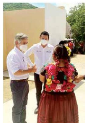
Antes de que concluya el 2021, entregará otros cinco planteles educativos

- "Impulso STEM", que busca fortalecer la formación en ciencia, tecnología, ingeniería y matemáticas (STEM, por sus siglas en inglés) y promover que las jóvenes de Oaxaca estudien ingenierías