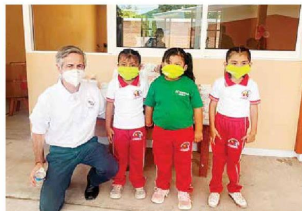
Iberdrola México se compromete a que las 50 escuelas reconstruidas tendrán paneles solares