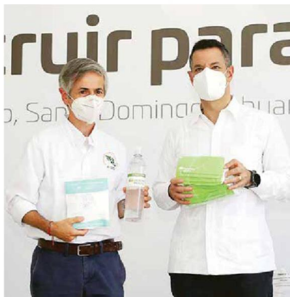
En alianza con autoridades gubernamentales, la empresa entregará material sanitario para el retorno seguro a las aulas en el Istmo de Tehuantepec

"Para mí lo más importante es la educación. Es el único tesoro que realmente le podemos dejar a nuestros hijos, porque con la educación