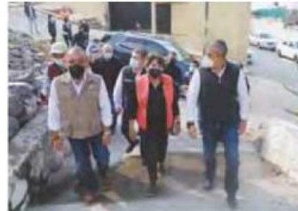
Autoridades federales y estatales supervisaron planteles escolares de Ecatepec.