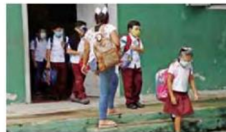
Clases. Miles de alumnos regresaron a las aulas.

■ Prueba Planea: Se aplica a nivel nacional y mide el sistema educativo con resultados diferenciados en subpoblaciones.