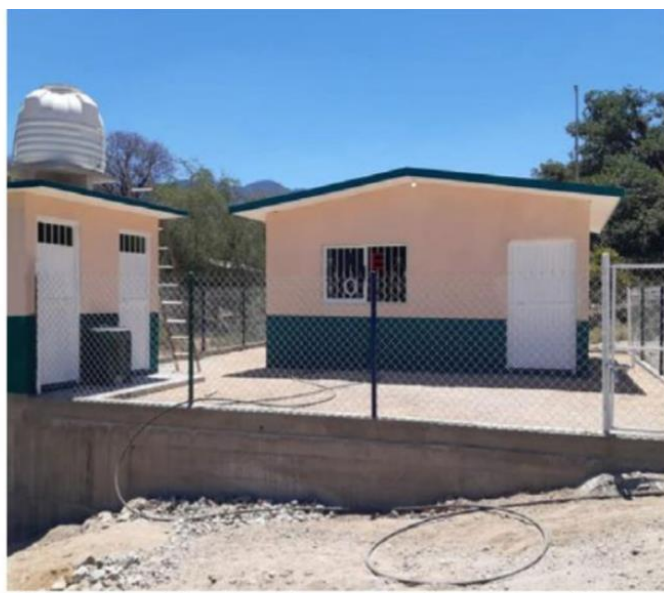
El Frijolar en la zona de Amaculí. Donde los padres de familia en conjunto con el Gobierno de México realizaron la construcción de Aula Educativa, 2 baños equipados y barda perimetral.

Si comunidades así lo determinan, dos o más planteles de localidades veci-