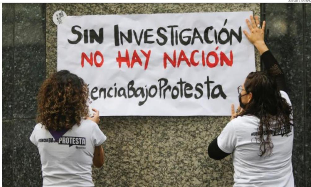
El jueves, catedráticos Conacyt se manifestaron afuera de la dependencia por otro problema legal con otro sector de la comunidad.

La dependencia que elaboró con la FGR denuncias penales contra el FCCyT y exfuncionarios negó en redes una “persecución”