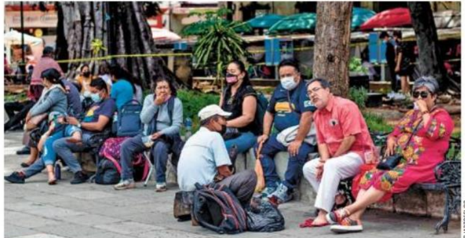
¡CUIDADO! Advierten autoridades oaxaqueñas que el cambio de semáforo no "significa que el riesgo es bajo".

Al regresar a semáforo verde y clases presenciales, el secretario de Educación de Guerre-