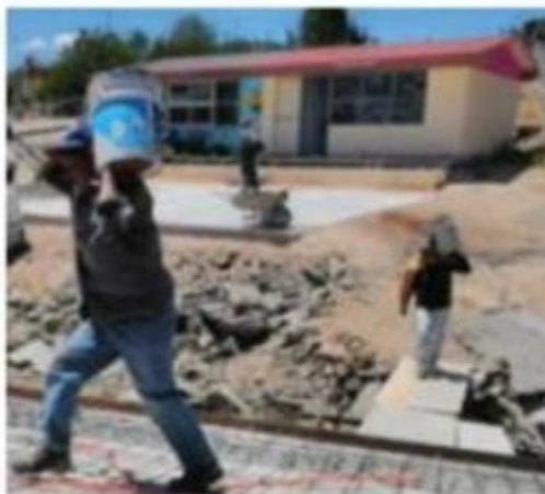
Recursos diluidos en opacidad.

Reprobados. Apoyo a colegios inactivos o cerrados, nula fiscalización e intervención abusiva de directivos del Consejo Nacional de Fomento Educativo (Conafe) también han ensuciado el programa La Escuela es Nuestra. Hay denuncias en distintas entidades del país, pero Crónica centró su investigación en Jalisco y, de manera específica, en la región de Zapotlán El Grande. PAG 6