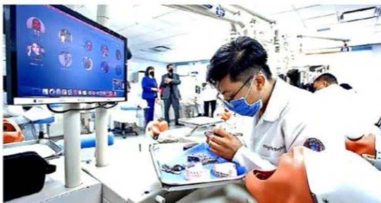
El 11 por ciento de alumnos de la Universidad Autónoma de Nuevo León volvieron ayer a clases presenciales.

Para este semestre, la Universidad cuenta con 918 aulas con el equipo tecnológico (cámaras, micrófonos y pantallas) que permite al profesor impartir su clases de manera simultánea con estu-