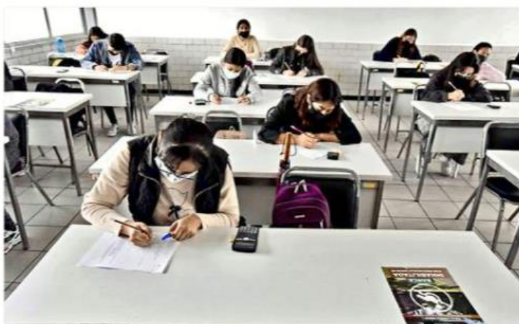
La UdeG invirtió 18 millones de pesos para la adquisición de ventiladores y medidores de CO2.

diantes presentes y conectados de manera virtual.