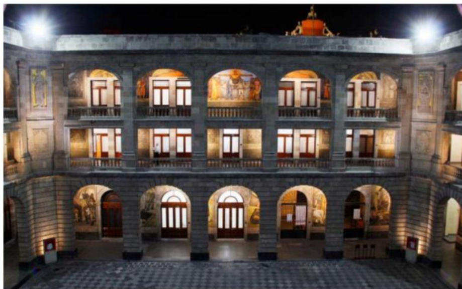
Las conferencias se llevarán a cabo del 6 de octubre al 2 de diciembre.