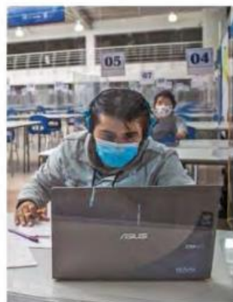
A DISTANCIA. Estudiantes de nivel superior siguen con clases en línea.

rectores, es lo más antidemocrático que puede haber, y manejan el presupuesto a sus anchas en forma discrecional”. /ANGEL CABRERA