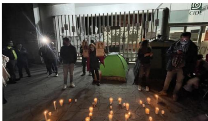
En redes sociales, los alumnos insistieron en que las instalaciones del CIDE han sido "recuperadas por estudiantes".

entre otras cosas, que la escuela no está cerrada sino recuperada por los estudiantes que rechazan a Romero Tellaache.