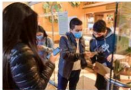
TIJUANA. Los establecimientos solicitan a los usuarios certificado de vacunación o una prueba PCR para poder ingresar.

En tanto, a partir de este lunes, Chihuahua regresa a semáforo epidemiológico naranja,