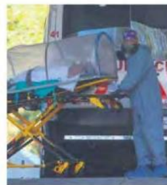
GRAVE. Una pareja es ingresada al área Covid del Hospital de los Venados.

En Guanajuato se mantuvo el inicio para este lunes, pues se encuentra en semáforo verde. En la Ciudad de México y el Estado de México se mantienen las clases presenciales.