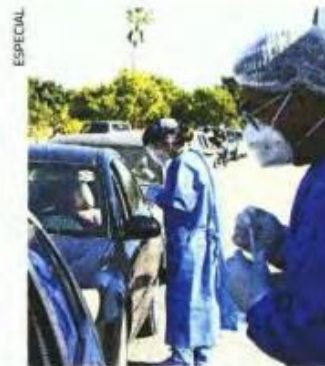
En Baja California Sur hacen fila para pruebas de Covid-19.

La presencia de flurona en Jalisco coincide con la llegada de la variante ómicron, que en las últimas dos semanas ha desplazado a la variante delta. ●