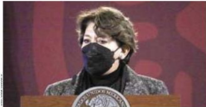
Delfina Gómez minimiza contagios.

El resto de las entidades se vacunará del 12 al 16 de enero comentó la secretaria y dijo que están en clases 17.5 millones de alumnos y un millón 800 mil trabajadores de la educación.