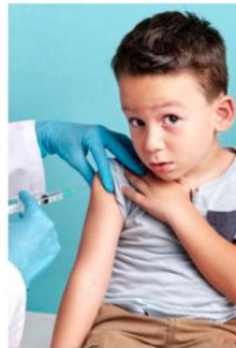
Ha sido vacunado 32.1% de niños entre 5 y 11 años.

Más del 80 % de la población de España está ya vacunada completamente, y los mayores de 40 años reciben, además, una dosis de refuerzo, empezando por las personas de más edad.