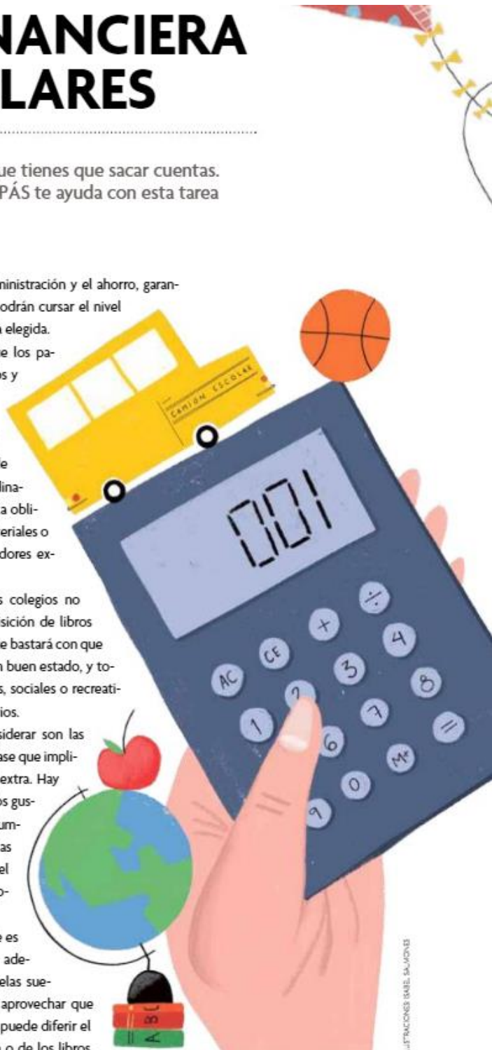
ILUSTRACIONES: EMEL SALVADOR

Una estrategia viable es pagar colegiaturas por adelantado, pues las escuelas suelen dar descuentos, y aprovechar que en ciertos planteles se puede diferir el costo de la inscripción o de los libros.