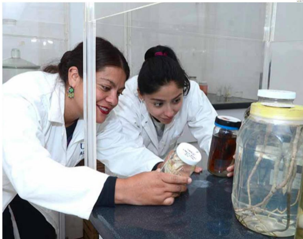
La UNAM envió una carta a Conacyt, Conamer y SE con una propuesta de equidad de género en el tema de becarías embarazadas.