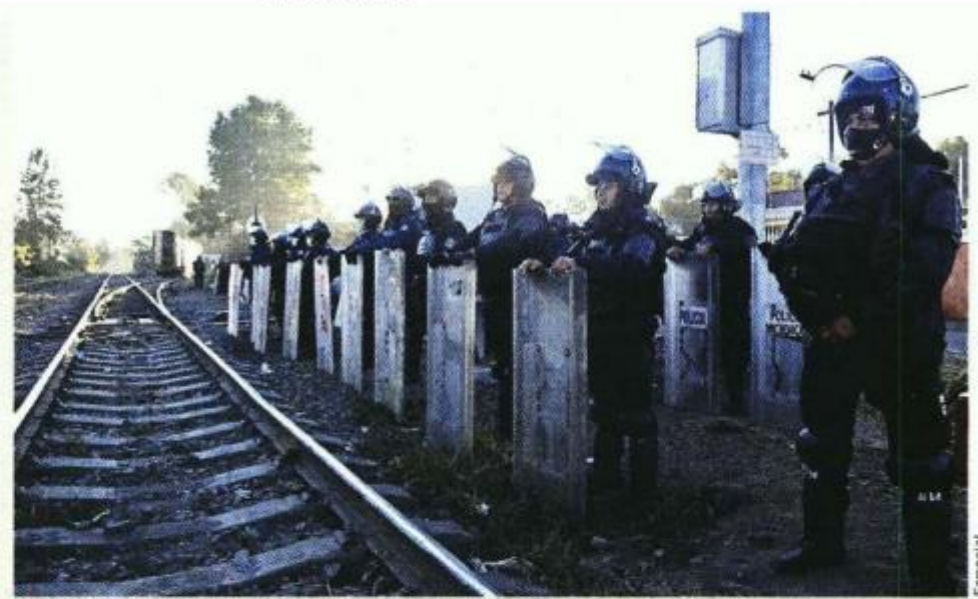
Elementos de la Guardia Nacional y de la SSP de Michoacán resguardaron las vías férreas.