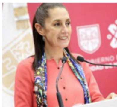
Claudia Sheinbaum, jefa de Gobierno capitalino.

Además, se llevó a cabo la rehabilitación de instalaciones eléctricas, hidro-sanitarias, se mejoraron baños y sustituyeron muebles, se realizaron trabajos de iluminación y adquirieron sillas, bancas o pupitres, mesas, pizarrones, extintores y libreros. ● (Ana Espinosa Rosete)