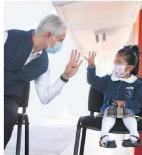
Del Mazo alienta clases presenciales