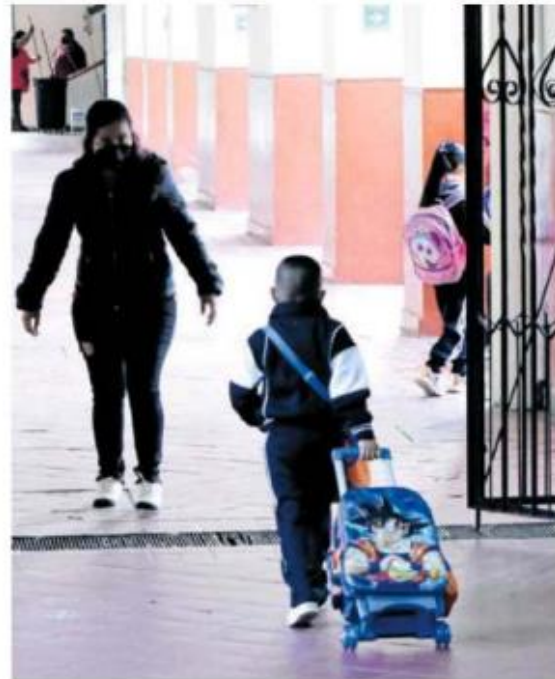
Padres de familia entrevistados respondieron que la beca había significado una mayor tranquilidad económica en sus hogares

La encuesta también señala que el 76.5 por ciento del monto de la transferencia se gastó en alimentación y en la conectividad y acceso a internet