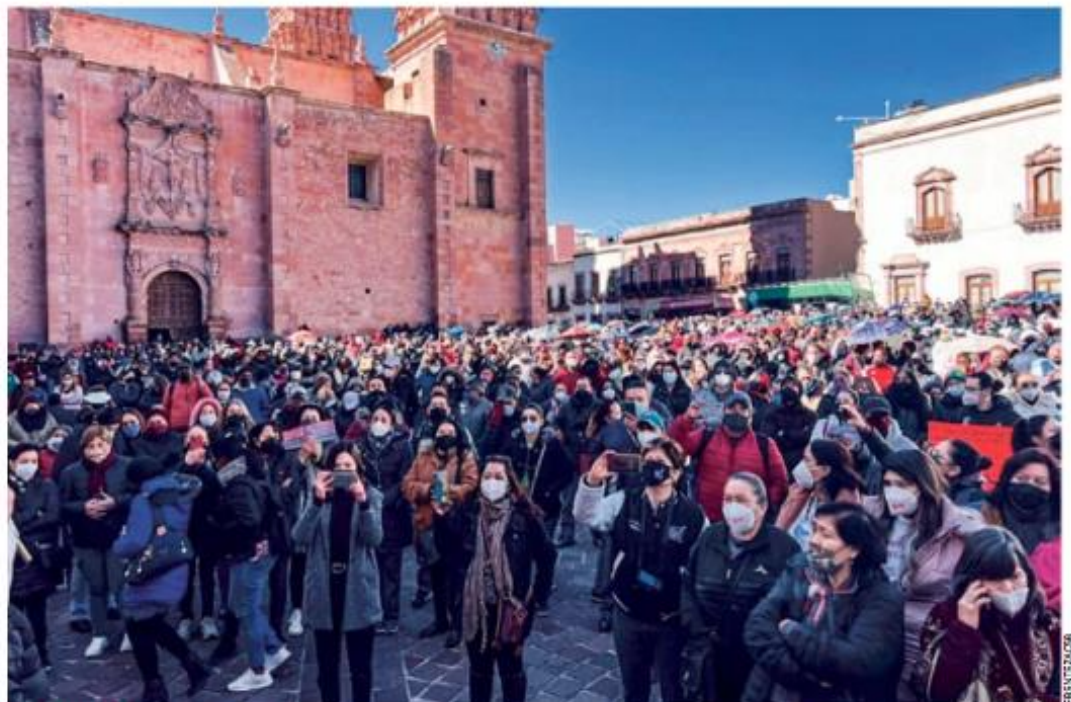
PROTESTA. Miles de docentes jubilados y en activos participaron en la manifestación frente al palacio de Gobierno zacatecano.

Sobre las declaraciones del gobernador Monreal en torno a que no es su responsabilidad el pago atrasado y que la lucha debe ser con el Gobierno federal, el líder magisterial aseguró que esta situación "se resuelve con inteligencia, con interlocución,