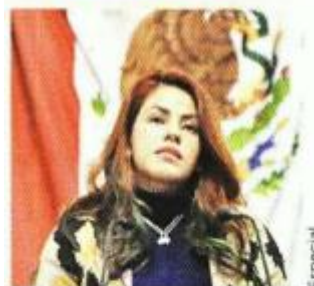
Gabriela Quiroga, diputada del PRD

Buscamos perfeccionar esta iniciativa bajo los principios (...) de los derechos humanos, de progresividad (...) así como (...) de igualdad".