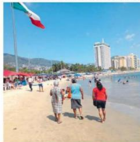
Muchos turistas llegan a Acapulco