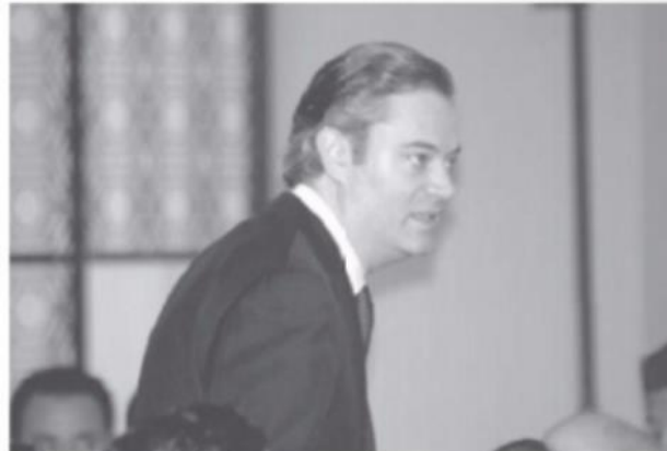
Titular de la SEP no tendrá un día de campo en la Cámara Alta

A 27 años de su muerte, en diferentes partes del país, panistas rindieron homenaje a Manuel J. Clouthier "Maquío". En su natal Sinaloa se le recordó con una misa, que se celebró en su Catedral, y una ofrenda floral en su estatua, donde se dieron cita el presidente municipal