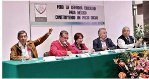
■ Rubén Núñez, líder de la Sección 22 (Izq.), participó en el foro "La reforma educativa para México".

En su intervención en el foro legislativo, Núñez respaldó el Plan para la Transformación de la Educación en Oaxaca (PTEO), rechazó la evaluación a los docentes