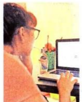
Desde 2020, las clases en la UNAM han sido virtuales.

QUEJAS fueron resueltas, de un total de 80 denuncias.