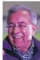
Rubén Rocha Moya

:::: Quienes andan en pleno “round” en Sinaloa, nos comentan, son el gobernador Rubén Rocha Moya (Morena) y el dirigente estatal de la Sección 53 del Sindicato Nacional de