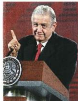
Presidente dice que su compromiso es alejarse del neoliberalismo.

El pasado 4 de febrero, el INE informó que a partir de la emisión de la convocatoria de la consulta de revocación de mandato y hasta el próximo 10 de abril, deberá suspenderse toda la propaganda gubernamental. ●