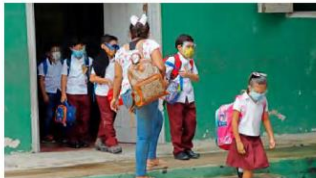
A FAVOR. El programa de escuelas de tiempo completo apoyaba con alimentación y horas de clase suplementarias a 3.6 millones de niños en condiciones de pobreza en México.

En cambio, el presidente de Morena, Mario Delgado, dijo que no les preocupa la desaparición de las escuelas de tiempo completo pues la Secretaría de Educación Pública está atendiendo esa estrategia, “hay que esperar a ver qué nos informan”.