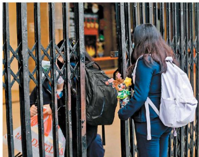
Estudiantes vuelven a las aulas luego del confinamiento.

*DIRECTOR DEL BANCO MUNDIAL PARA MÉXICO, COLOMBIA Y VENEZUELA