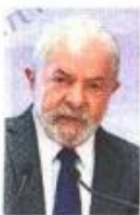
Lula da Silva

:::: Pocas veces el Senado se ha visto con tanta restricción al libre tránsito como ayer, debido a la visita del expresidente de Brasil Luiz Inácio Lula da Silva . Los pasillos y accesos fueron cerrados varias horas para evitar que cualquier persona pudiera acercarse al político sudamericano. Estas medidas no fueron muy del agrado del exmandatario. Algunos de los integrantes de la delegación brasileña comentaron que a Lula le hubiera gustado que permitieran que empleados del Senado y visitantes pudieran saludarlo a su paso. Pese a todo, legisladores de Morena, PT, Partido Verde y PES, pudieron acercarse a Lula, llenarlo de elogios y tomarse fotos y selfies hasta el cansancio. Mario Delgado , líder nacional de Morena, ganó halagos por haber gestionado la visita del rockstar brasileño; aunque tuvo que ceder su lugar al lado del líder carioca ante la exaltación de los asistentes.