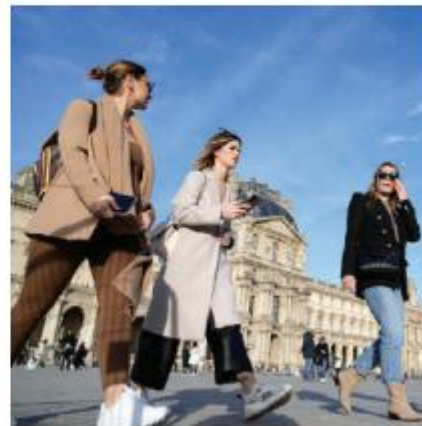
TURISTAS caminan frente al Museo de Louvre, sin cubrebocas.

vierten que sin un plan B la región podría volver a los repuntes, pues en la última semana sumó 60 mil contagios, 10 mil más que en el periodo previo.