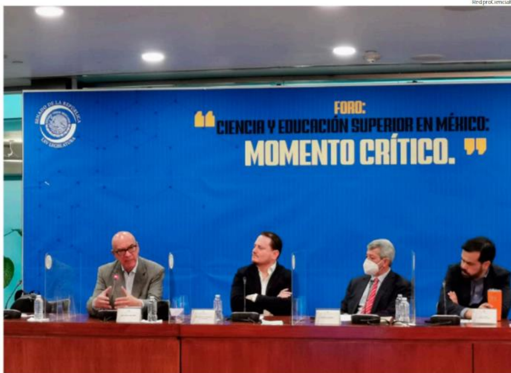
En el Senado se llevó a cabo el Foro Ciencia y Educación Superior en México. Momento Crítico.

Si un gobierno busca actuar sobre las instituciones de educación superior, es para fortalecerlas no para subordinarlas, añade