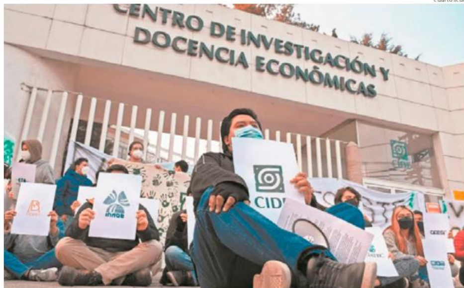
Estudiantes del CIDE en una de las múltiples muestras de repudio a su director y a Conacyt.

Durante el Foro “Momento crítico. Ciencia y educación superior en México”, repasó la historia del CIDE de los últimos