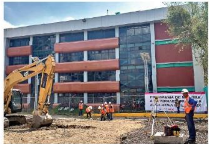
La Preparatoria José Revueltas entró en su tercera etapa de ampliación para atender hasta mil 200 alumnos.

El plan de rehabilitación de infraestructura educativa se anunció durante la tercera etapa de obras de ampliación en la Preparatoria José Revueltas.