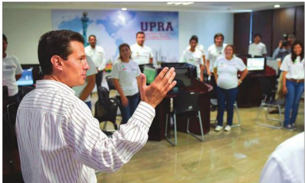
El presidente Enrique Peña Nieto convivió con estudiantes de la Universidad Politécnica de Ramos Arizpe.

"El modelo que está construido para enseñar en estos tecnológicos es el mismo y está estandarizado con otros modelos que se siguen en otros países de mayor desarrollo".