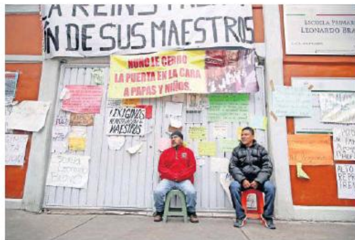
Los padres determinaron que mantendrán el control del plantel y no permitirán el ingreso de profesores sustitutos de la SEP.

“Este es un movimiento de padres de familia que estamos inconformes con las decisiones que toma la SEP y afectan a nuestros hijos, sin tomarnos