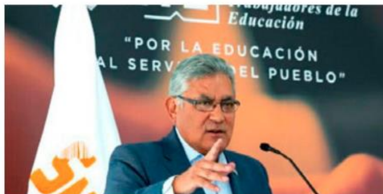
El SNTE conmemoró el Día Internacional del Trabajo.