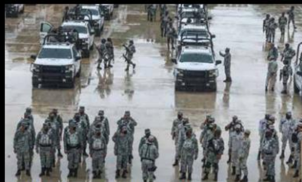
La Guardia Nacional es una entidad que está por pasar a la Sedena, pero en los hechos opera como instancia militar.

“Se observa una deficiencia tremenda porque solamente se puede hacer utilización de la fuerza letal cuando hay un nivel