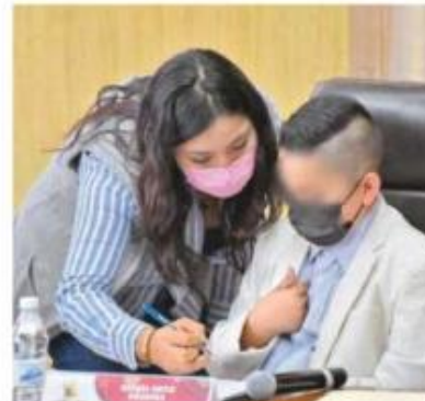
Niñas y niños que participaron en el Cabildo Infantil tomaron protesta y posteriormente expusieron los diversos temas

nombre de la infancia de este municipio decidan, además de que serán asesorados por los regidores y síndicos para llevar a cabo este trabajo a cabalidad y de forma apropiada.