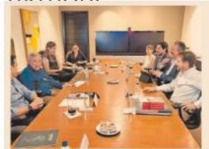
Rocha se reunió con la AMEXCID, organismo que promueve alianzas estratégicas con el sector privado, académico, y gobiernos locales.

Y el cuarto eje se refiere a las Acciones de Cooperación Internacional con Gobiernos Locales.