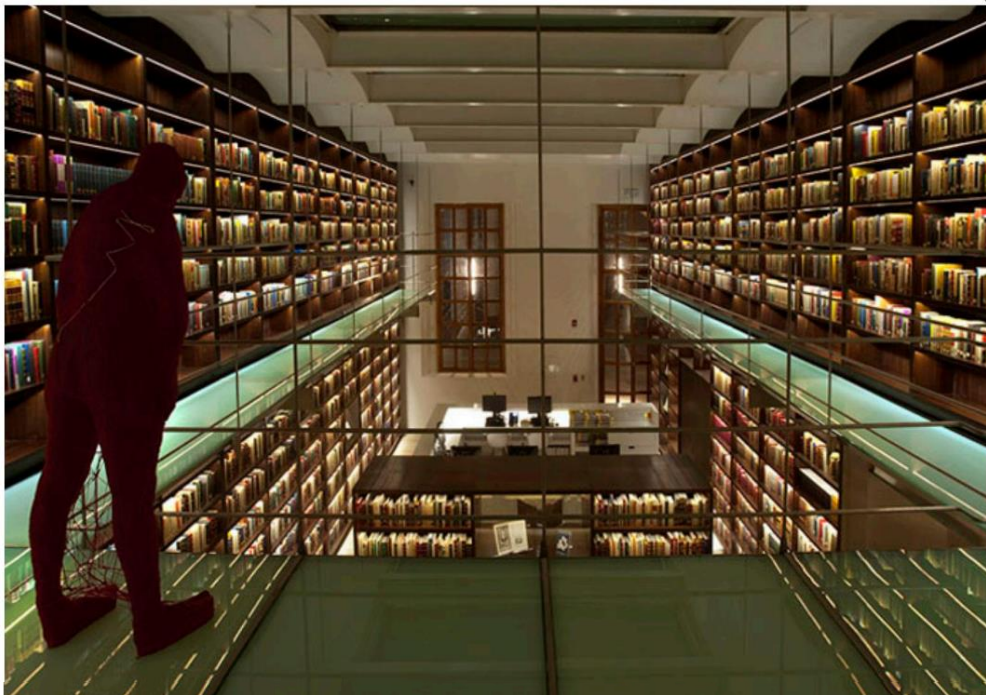
La Biblioteca de México es una de las tres que reciben depósito legal.

“Rodrigo Borja porque miente flagrantemente de un desistimiento de amparos que no existe y habla de soluciones inexistentes”