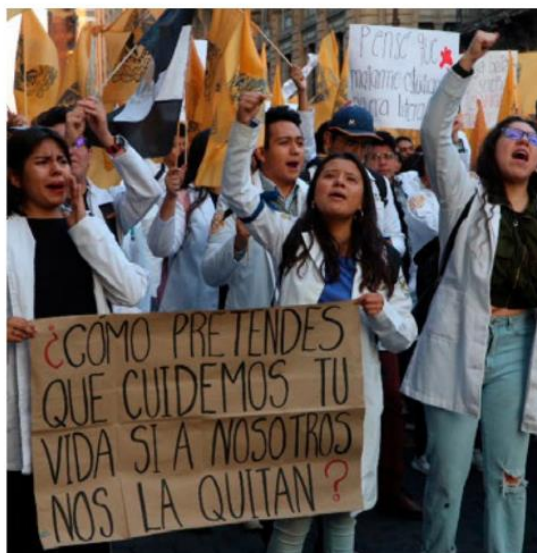
En los peores momentos de la pandemia médicos y estudiantes en todo el país exigían equipo profesional para seguir salvando vidas.

En abril de 2020, por la falta de equipos y capacitación para atender la contingencia, argumentó, la escuela de la UNAM —a la que después se le sumaron Iztacala y Zaragoza— decidió