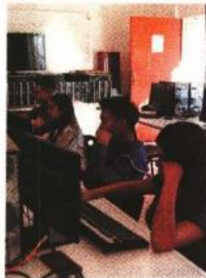
La CDMX instalarà wifi en 2 mil 600 escuelas pùblicas.

“No podemos hacer que solamente el que tenga dinero lo pueda hacer, porque entonces se vuelve un privilegio y no se vuelve un derecho; para nosotros el internet tambièn es un derecho”, declaró. ●