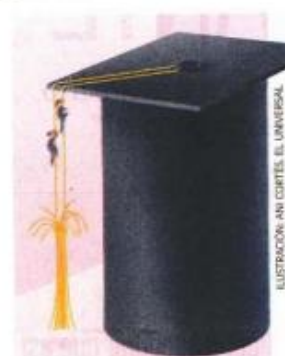
ILUSTRACIÓN: ANA CORTÉS / EL UNIVERSAL