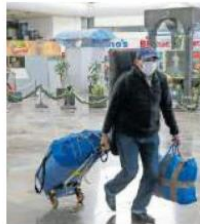
Ahorro en transporte, opción en vacaciones.

También de la UNAM; IPN; Universidades de toda la República; Institutos; Escuelas Libres de Derecho, Comercio y Homeopatía; Colegio de Bachilleres; y las escuelas incorporadas a las antes mencionadas.