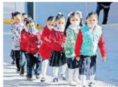
El Estado de México quiere garantizar el acceso a primaria

Todos los trámites son gratuitos y los interesados podrán realizar su solicitud correspondiente en www.edomex.gob.mx , en el apartado PAEB, que se encontrará habilitado las 24 horas del día, los movimientos estarán sujetos a la disponibilidad de lugares en la escuela y el turno correspondiente.