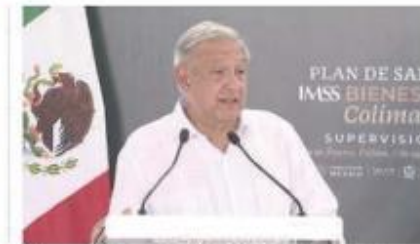
El presidente Andrés Manuel López Obrador. Especial

Al asegurar que la corrupción también será combatida en este sector informó que en Colima no habrá aviadores, por el contrario llegaran a trabajar un total de "55 especialistas del pueblo hermano de Cuba".