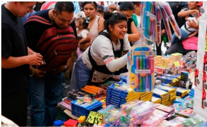
Entre los sectores que se verán más beneficiados son papelerías, zapaterías y tiendas comerciales.

La Secretaría de Desarrollo Económico (SEDECO) dio a conocer que la actividad comercial relacionada con el regreso a clases en las más de 10 mil 600 escuelas públicas y privadas de distintos niveles educativos que existen en la Ciudad de México, dejará una derrama económica de 4 mil 740 millones de pesos, que beneficia principalmente a los sectores de comercio y servicios.