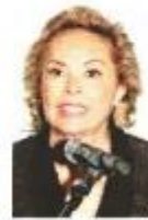
Elba Esther Gordillo

:::: Quien reapareció este lunes fue la exlíderesa del Sindicato Nacional de Trabajadores de la Educación (SNTE), Elba Esther Gordillo . Desde su cuenta en Twitter, la maestra habló sobre la profesora Leticia Ramírez , nueva titular de la Secretaría de Educación Pública (SEP), y dijo que con nuevos liderazgos es necesario que haya nuevos diálogos. Y, de entrada, se manifestó a favor de que se reestablezcan las Escuelas de Tiempo Completo, pues dijo que es necesaria la alimentación de los menores y horarios ampliados en los colegios. Quienes conocen a la nueva secretaria de Educación, aseguran que sería muy complicado que diera marcha atrás a una medida que su antecesora defendió con fuerza y que cuenta con el aval presidencial. La maestra Gordillo, nos adelantan, estará estos días activa en medios de comunicación hablando del tema.