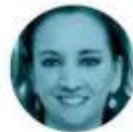
CLAUDIA RUIZ MASSIEU

› Después de la violencia de los últimos días en algunos puntos del país, el presidente López Obrador realizará una gira de trabajo por Baja California y Sonora. Nos informan que el mandatario encabezará una reunión en Tijuana para revisar la estrategia de seguridad en la región, y, después, conducir la conferencia matutina.