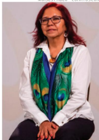
Leticia Ramírez Amaya.

datario mientras hacia la presentación de la nueva responsable de la SEP.