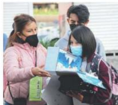
El ciclo escolar 2022-2023 contará con 190 días de clases oficiales.

El regreso a clases, como lo marca el calendario de la dependencia federal, es el 29 de agosto y el ciclo escolar 2022-23 contará con 190 días de clases oficiales.