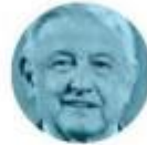
ANDRÉS M. LÓPEZ O.

› Más de uno se quedó con ojos de plato después de que el presidente Andrés Manuel López Obrador anunció que Leticia Ramírez será la nueva titular de la Secretaría de Educación Pública, esto, en sustitución de la maestra Delfina Gómez . Asimismo, mucho cuestionaron su poca experiencia en la materia, pero realmente pocos saben que es de las operadoras más cercanas al mandatario, así como a los sindicatos magisteriales, tanto de la CNTE como del SNTE.