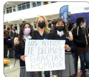
pan las diferentes direcciones de su gobierno.

se han realizado acciones como pintado de edificios, puertas y áreas comunes; rehabilitación de aulas, jardineras, sanitarios y techos; reforestación de áreas verdes, reparación de bardas perimetrales e instalación de sistemas captadores de lluvia, entre muchas otras en las que partici-