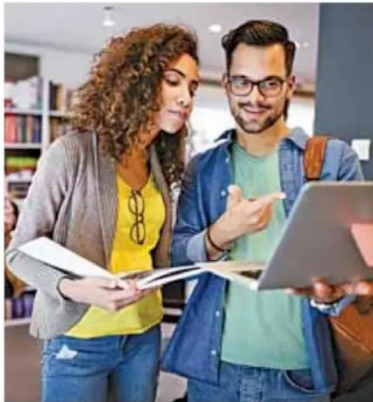
Necesidades. Se busca trabajar y estudiar a la par.

Hoy, muchos de ellos buscan retomar las clases, pero sin des-