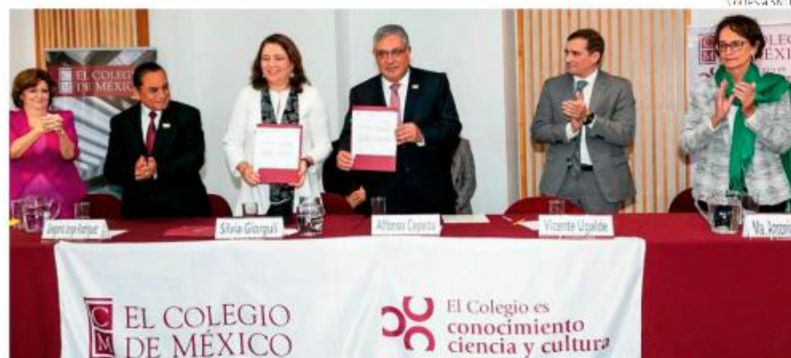
El SNTE llegó hasta el Colegio de México, excelsa institución educativa del país, para firmar un convenio que capacitará a maestros de 1° a 3° de Primaria.

"Saber leer y escribir es un derecho humano y poder vivirlo es un beneficio de la cultura", manifestó.