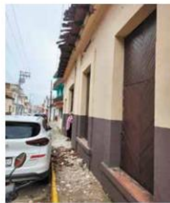
SALDO. Ayer se desprendió una fachada en la colonia Tránsito, en la CDMX.

sión de tanque de gas y resultaron lesionadas tres personas, una mujer y dos menores de edad.