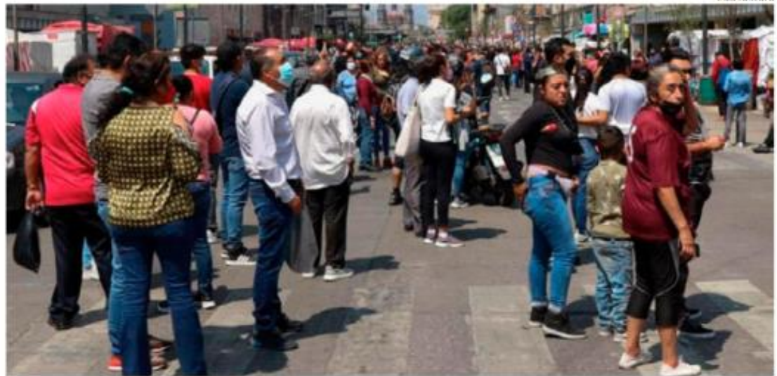
Ciudadanos salieron a las calles en cuanto sonó la alerta sísmica.

La Jefa de Gobierno, Claudia Sheinbaum, detalló que el 99.1 por ciento de las alertas sísmicas funcionaron de manera adecuada tanto en el simulacro como en el sismo. Dio a conocer que durante el simulacro todas las instituciones