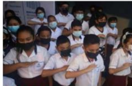
Autoridades educativas de Morelos suspendieron sus clases vespertinas.

de intensidad 7.7. Al respecto, el Instituto de Educación Básica (IEBEM) informó que ningún alumno resultó afectado, no obstante, las clases se suspenderán para atender los inmuebles y evitar alguna circunstancia por las réplicas del temblor. Las clases se reanudarán este martes. • Finalmente, la Secretaría de Educación Jalisco, así como la Universidad de Guadalajara, informaron que, para prevenir y resguardar a la comunidad estudiantil, se suspenden clases para el turno vespertino en educación básica, preparatoria y universidad.