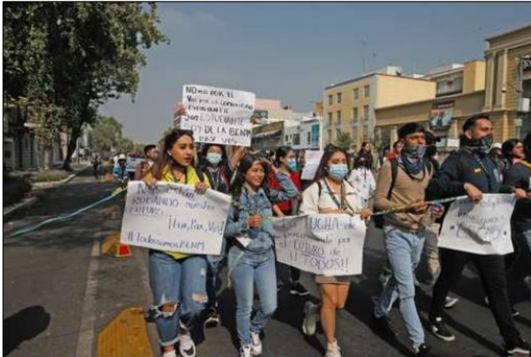
▲ Unos 300 estudiantes de la Escuela Nacional de Maestros protestaron para exigir retomar las clases presenciales, suspendidas desde hace un mes.