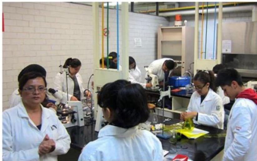
Alrededor de 5 mil científicos se quedarán sin estímulo económico y otros 5 mil ni siquiera el nombramiento.

Investigadores en redes han exhibido que Conacyt ha solicitado a las Comisiones Dictaminadoras del SNI, conformadas por los miembros del mismo sistema, a recurrir a un mecanismo de “prelación” para decidir qué investigadores recibirán estímulos económicos y quiénes no —el Diccionario del Español de México define “prelación” como la re-