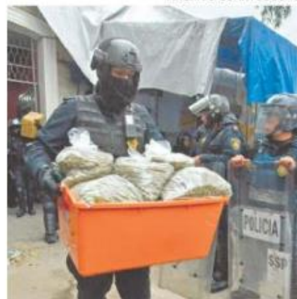
Sedena lleva el registro de decomisos