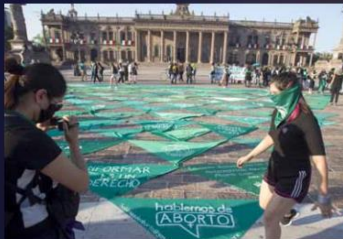
Colectivas presentaron una iniciativa contra la criminalización del aborto el 28S.

La redacción de la Constitución propuesta por Samuel García sí incluía la protección a la “vida desde la concepción”, sin embargo, no fue publicada así en el Periódico Oficial debido a que es considerado inconstitucional por la Corte