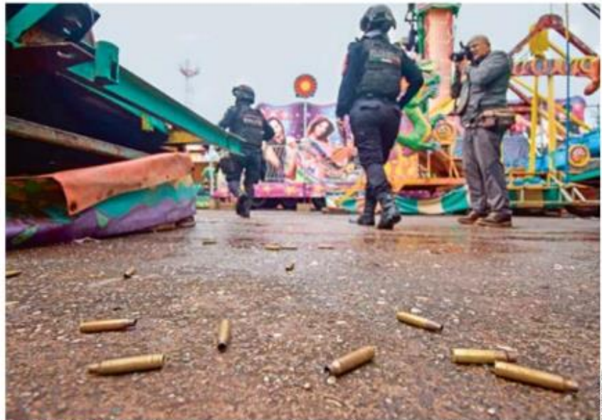
UN DÍA DESPUÉS. Casquillos percutidos permanecen entre los juegos mecánicos de la feria que se realizaba en Totolapan, este miércoles, cuando se dio el ataque al palacio municipal.

El ayuntamiento está custodiado por decenas de soldados, a quienes agentes de la Fiscalía les hicieron compañía ayer para realizar los peritajes del inmueble.