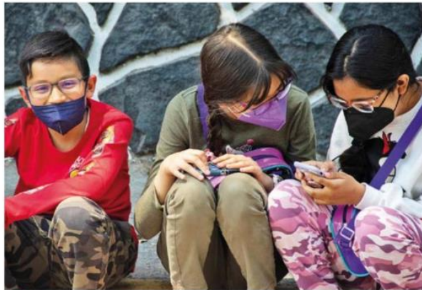
TÉRMINO. El médico advirtió que no hay una fecha definida para el término de la pandemia, por lo que pidió seguir con el uso del cubrebocas.

rran las ventanas y procuran hacer todo en interiores”.