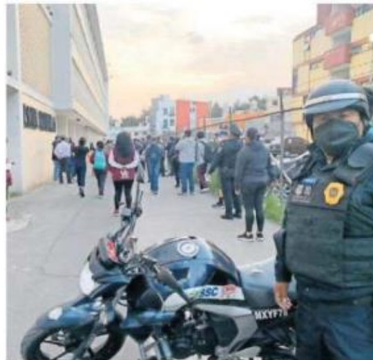
En la Venustiano Carranza alumnos y viandantes estar n m s seguros al ponerse en marcha operativo policiaco /CORTESI 

Finalmente seal  que "si en los alrededores de las escuelas se encuentran autom viles abandonados, transportes de carga, autobuses de pasajeros, los retiramos para tener la certeza de que las alumnas y alumnos tengan un sendero seguro".