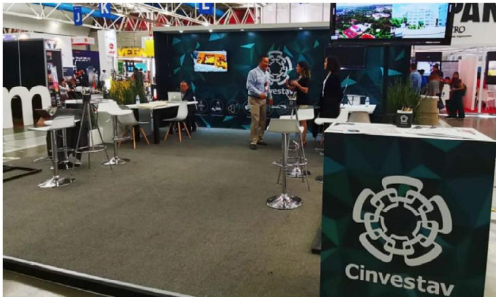
El encuentro fue organizado por el Cinvestav y el 20 por ciento de los participantes labora en esa institución científica pública.

VÍNCULO ACADEMIA-INDUSTRIA. La Tormenta de Proyectos o RDI Projects