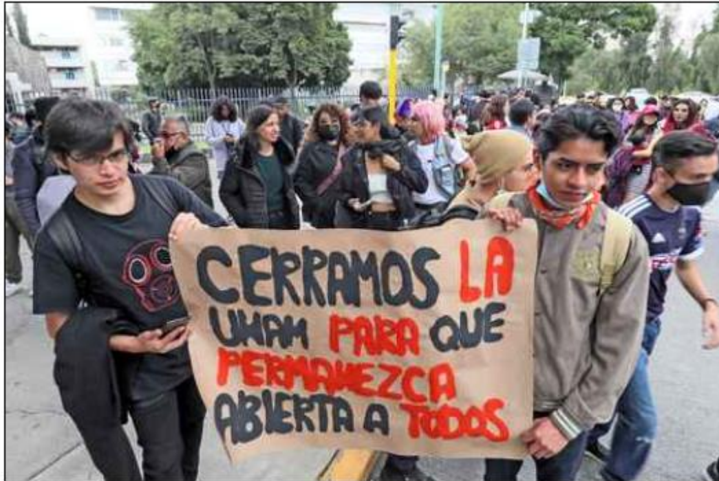
▲ Marcha de estudiantes del Politécnico y la UNAM en CU.