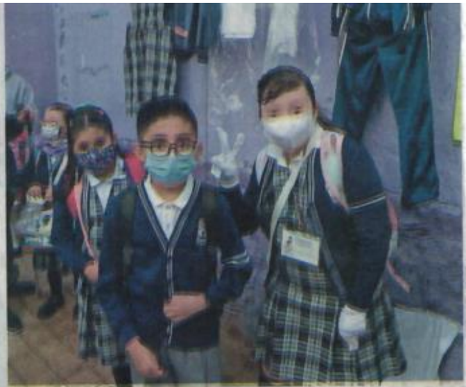
Mi Beca para Empezar es un apoyo mensual que se otorga de manera universal a 1.25 millones de niños que asisten a escuelas públicas.