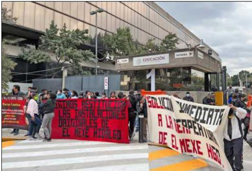
▲ Alumnos estuvieron afuera de las instalaciones de la SEP para apoyar a sus representantes.